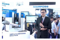
展位采访及拍摄 (专业摄影团队提供支持)